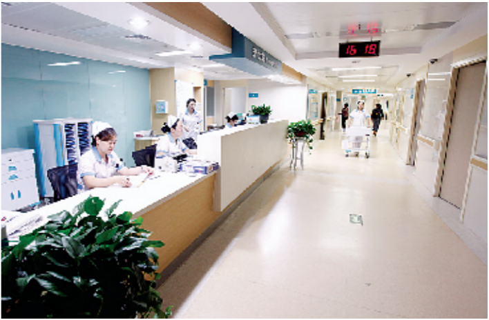
环境整洁、设施齐全的病区

破解群众“看病难”,改善医疗环境,一直是驻马店市中心医院孜孜追求的目标。从2003年起,该院着力于改善患者就诊和住院环境,先后建成门诊大楼、东区病房大楼和16层病房大楼。尤其是2013年建成的16层病房大楼,进一步缓解了群众“看病难”的问题,改善了患者住院环境和