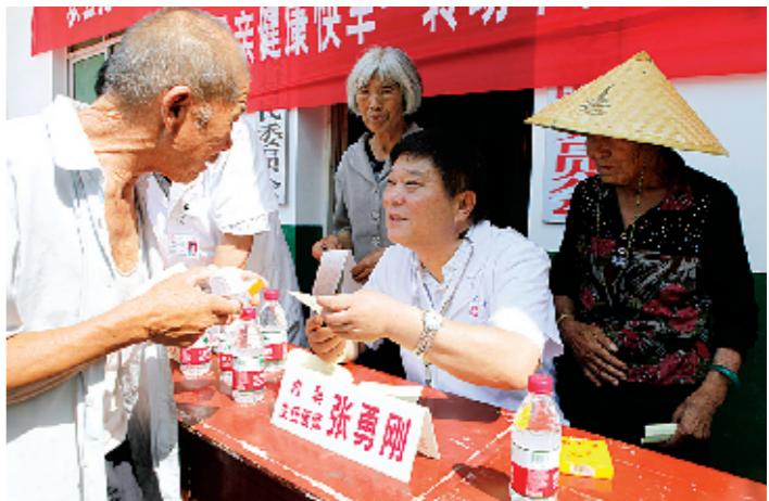
专家到农村宣传新农合政策

奇德逸丽,香气扑鼻。时至今日,驻马店市中心医院新农合工作取得了令人满意的业绩,凝聚着该院领导班子的智慧和心血,流淌着1900多名干部职工的辛勤汗水,走上了制度化、规范化、正规化的轨道。新起点、新旅途,驻马店市中心医院再次扬帆起航,向着美好未来远航!让新农合沐浴在春风里,绽放在花丛中。