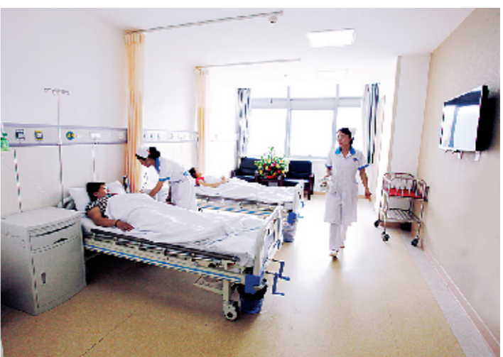
温馨、舒适、宽敞明亮的病房