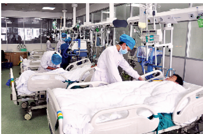
现代化的重症病房

合就诊流程图、导医触摸屏、“一站式”跟踪服务、网上挂号,增加专家坐诊次数等诸多便民措施,为就诊、住院患者提供了方便;门诊大厅、16层新病房大楼大厅购置了近10台自助机,患者来院就诊时,只需携带二代身份证,即可在自助机上办理就诊卡。